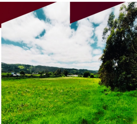
ORILLA CARRETERA CARAHUE - PTO. SAAVEDRA