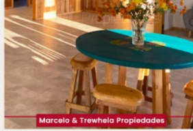
Marcelo & Trewela Propiedades