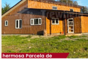
hermosa Parcela de