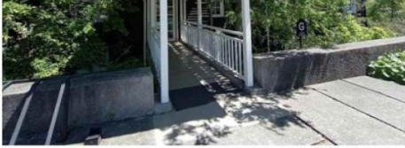
ACCESO EDIFICIO G